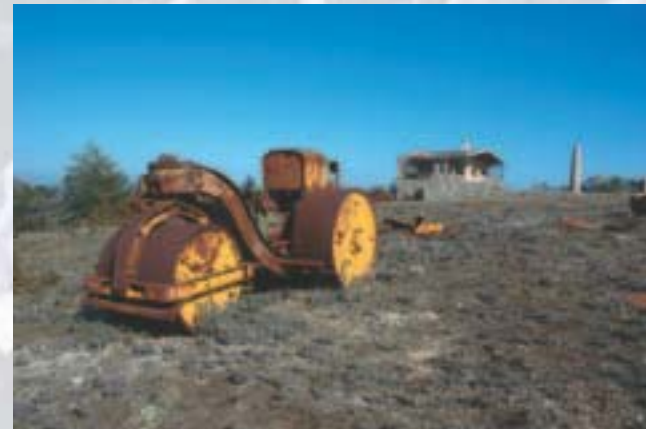
Els Motllats. Serra de Prades

Una de les accions sobre instal·lacions obsoletes que més ressò internacional ha tingut, va començar durant l'estiu de 1992 quan Mountain Wilderness d'Itàlia va iniciar la pressió –amb diverses manifestacions i molts altres actes– per aconseguir el desmuntatge d'un espectacular repetidor de ràdio abandonat sobre l'Agulla de Tré-la-Tête, a 3.920 metres d'alçada. Finalment, el setembre del 2002 es retira aquesta instal·lació amb un cost de desmuntatge de 41.000 euros, finançat íntegrament pel govern regional de la vall d'Aosta.