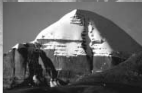
Le Mont Kailash - 'E. Bernbaum

Edwin Bernbaum, adapté de "Montagnes sacrées du monde", (Sacred Mountains of the World), University of California Press, 1998 Traduction de G. Privat